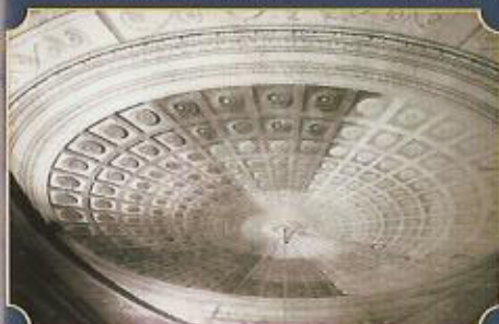
Illusionistische Kuppel um 1800