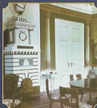
Klassizistisches Mobiliar, Photo 1943