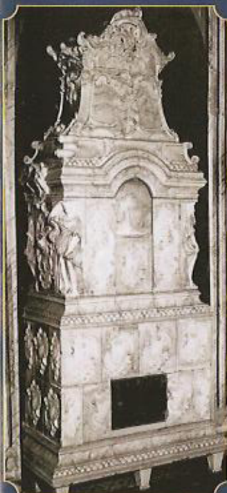
Rokoko-Ofen um 1750