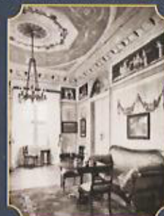
Gemalte Tapeten um 1800