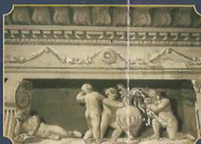
Figürliche Illusionsmalerei um 1800

Einmalige Originalaufnahmen der Burg und ihrer außerordentlich wertvollen Innenausstattung von vor 1945, die in Mecklenburg-Vorpommern ihres Gleichen sucht und durch aufwendige Restaurierung zum größten Teil wieder herstellbar ist.