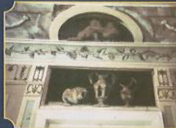
Malerei im pompejanischen Stil um 1800