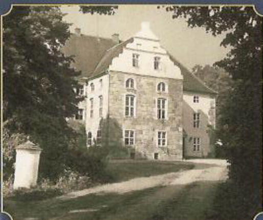
Renaissance-Fassade an der Vorderseite, Photo 1937