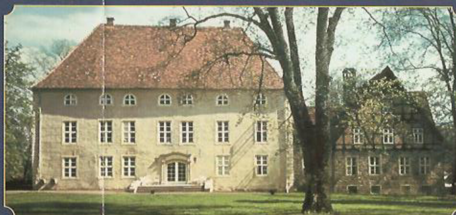
Klassizistische Fassade auf der Parkseite, Photo 1943