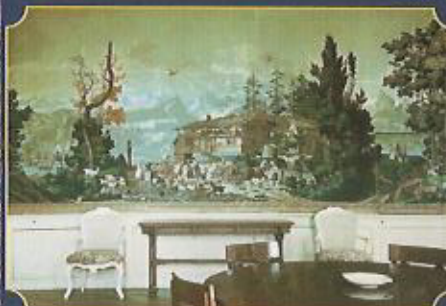
Landschaftstapete von 1814